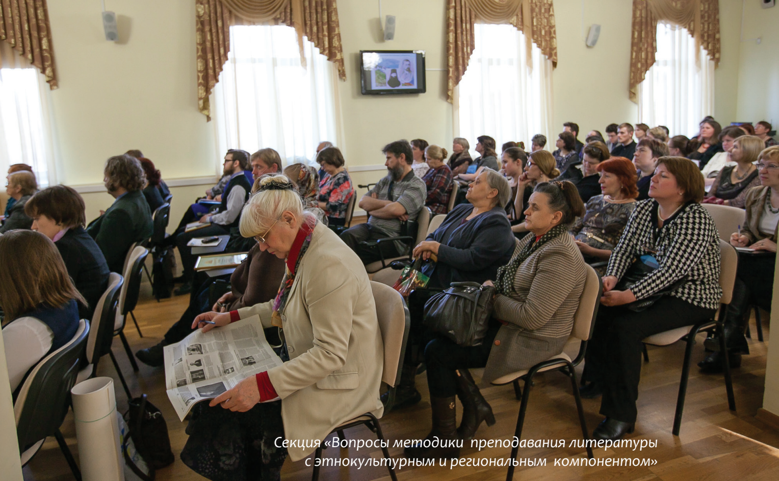
Секция «Вопросы методики преподавания литературы с этнокультурным и региональным компонентом»

«Краем ведает краевед, не страшны ему дороги, по неизведанному пути он идет, не жалея ноги» – таков был наш девиз. Кроме этого изучалась история села, школы, и, конечно, писалась Летопись Великой Отечественной войны. Почти за 20 лет материала накопилось столько, что работать с ним «на общественных началах» было просто невозможно. Встал вопрос: быть или не быть в Улановской школе музеем? Оказалось – быть!