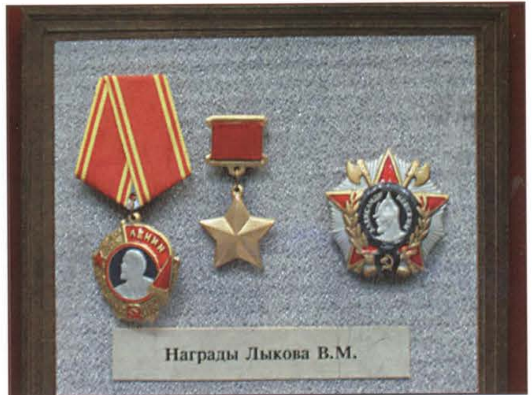
Лыков В. М. Музейные экспонаты