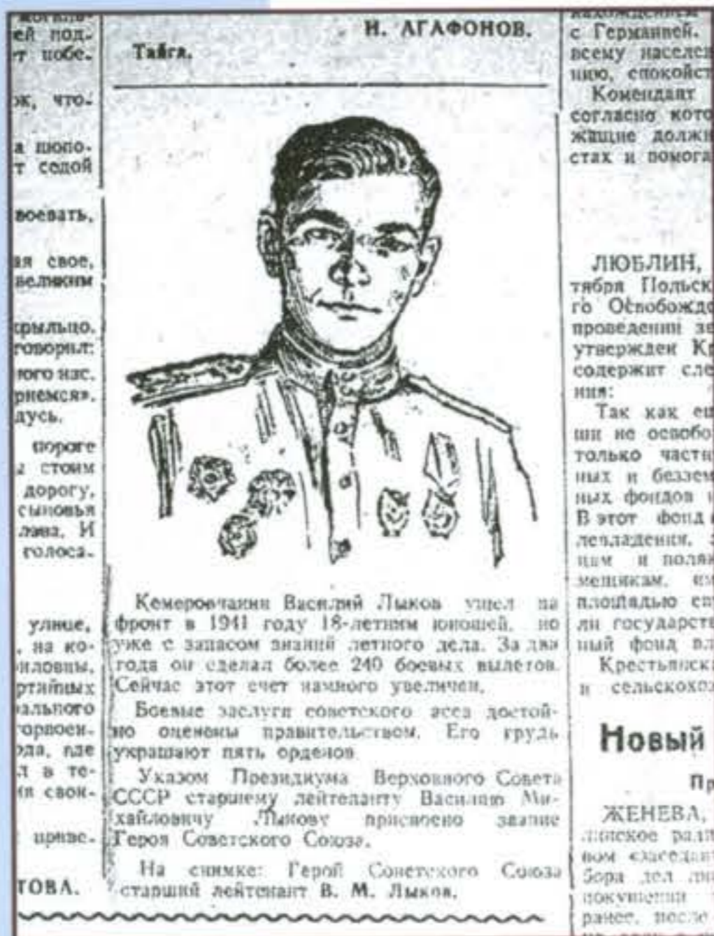
Лыков В. М. Газета «Кузбасс», 1944, 13 сент.

ГЕРОИ СОВЕТСКОГО СОЮЗА, ГЕРОИ РОССИЙСКОЙ ФЕДЕРАЦИИ — КУЗБАССОВЦЫ, УЧАСТНИКИ ВЕЛИКОЙ ОТЕЧЕСТВЕННОЙ ВОЙНЫ (1941–1945 гг.)