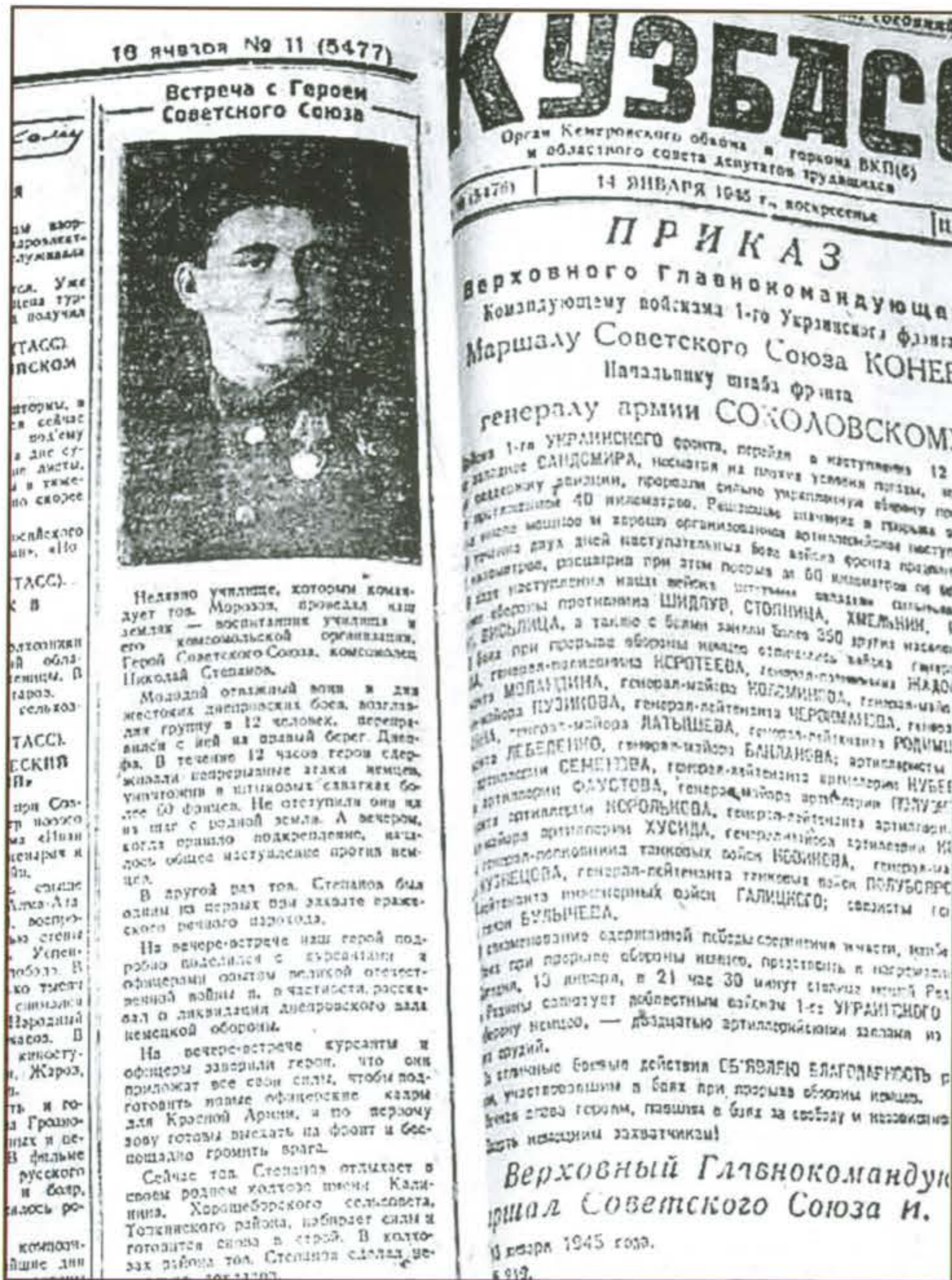
Степанов Н. П. Газета «Кузбасс», 1945, 16 янв.