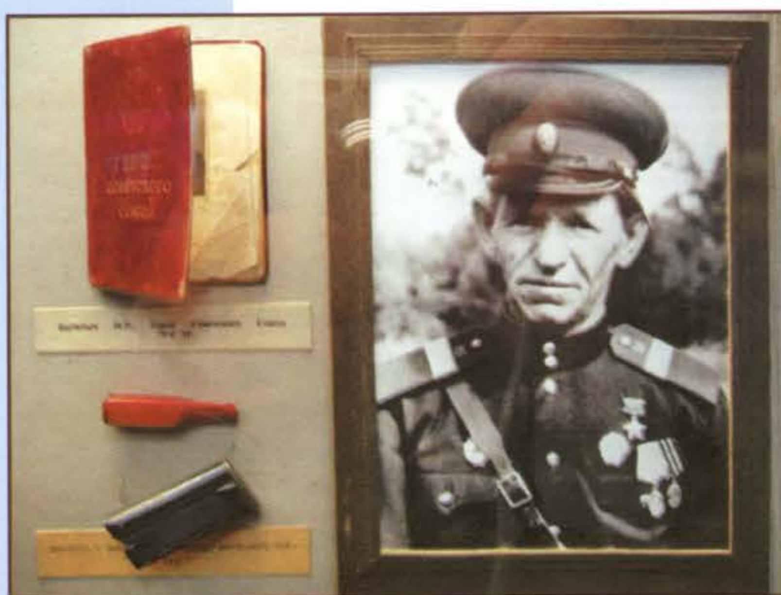
Васильев И. Р. Фото и музейные экспонаты